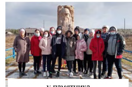
у памятника Буташевича-Петрашевского

И это только часть наших мероприятий, проведенных в рамках проекта. Для себя мы сделали вывод, что краеведческая работа, в рамках внеурочной деятельности, позволяет добиться уважительного отношения к своей малой Родине, сформировать нравственные, эстетические и патриотические ценности школьников, проявлять самостоятельность и осознавать личную ответственность.